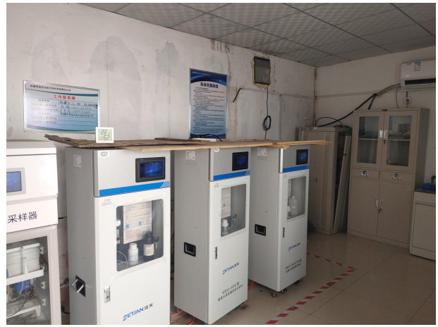
项目在线监测设备