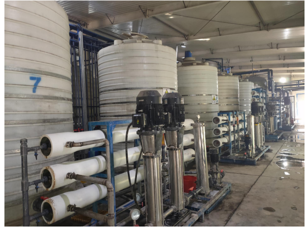
含磷洗箔废水回收系统