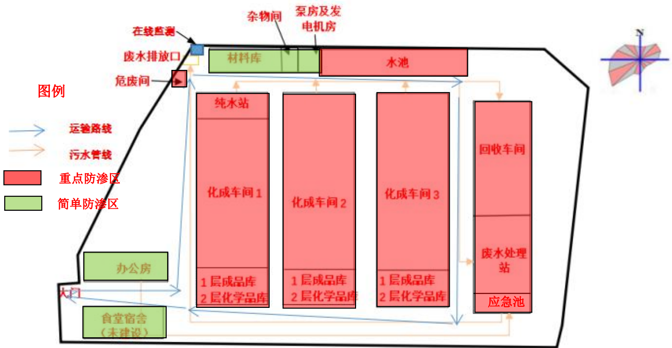
项目厂区平面布置示意图