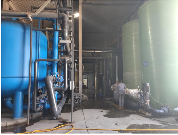
不含磷洗箔废水回收系统