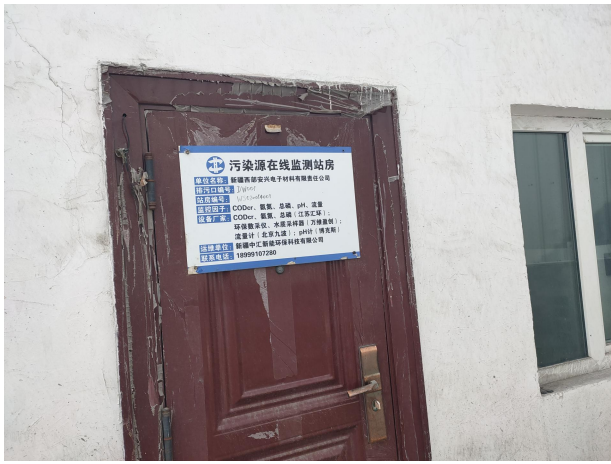
项目在线监测站房